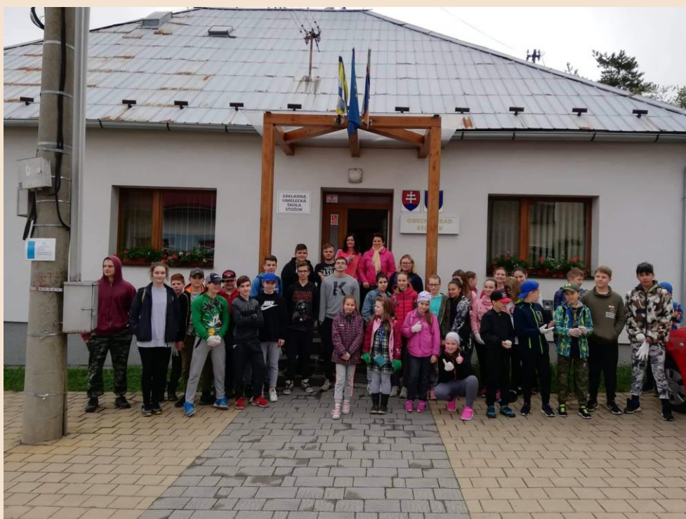
Deň Zeme v obci