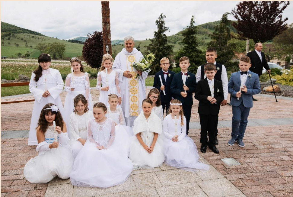
Prvé sväté prijímanie