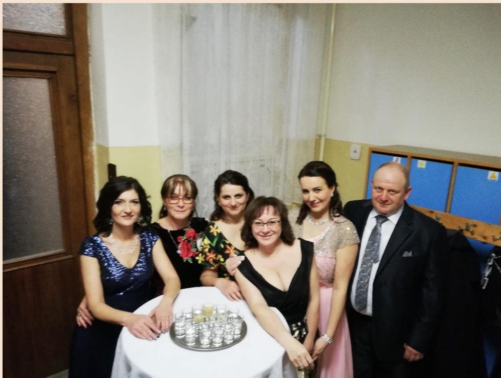
Obecný ples v Stožku