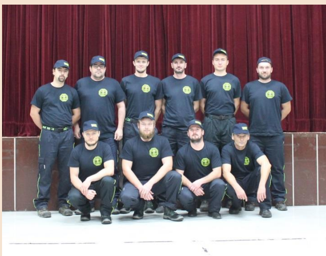
DHZO Stožok, rok 2020