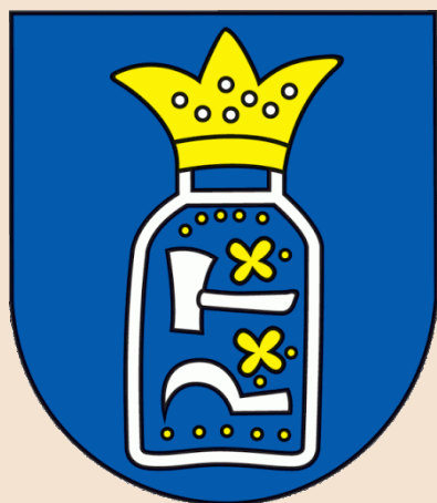
Obrázok č. 2 – Erb obce Stožok

Vlajka obce pozostáva zo šiestich pozdĺžnych pruhov vo farbách modrej (1/8), žltej (2/8), bielej (1/8), modrej(1/8), bielej(2/8) a žltej(1/8). Vlajka má pomer strán 2:3 a ukončená je tromi cípmi, t.j. dvoma zástrihmi, siahajúcimi do tretiny jej listu.