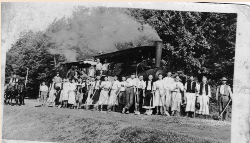
Obrázok 1- Budovanie cesty I. triedy, fotografia z roku 1932 ( fotoarchív Obecnej kroniky )

Zdroj: https://www.stozok.sk/obec-stozok/historia-obce