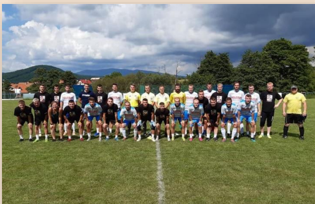
Futbalový turnaj FEROCUP, rok 2020