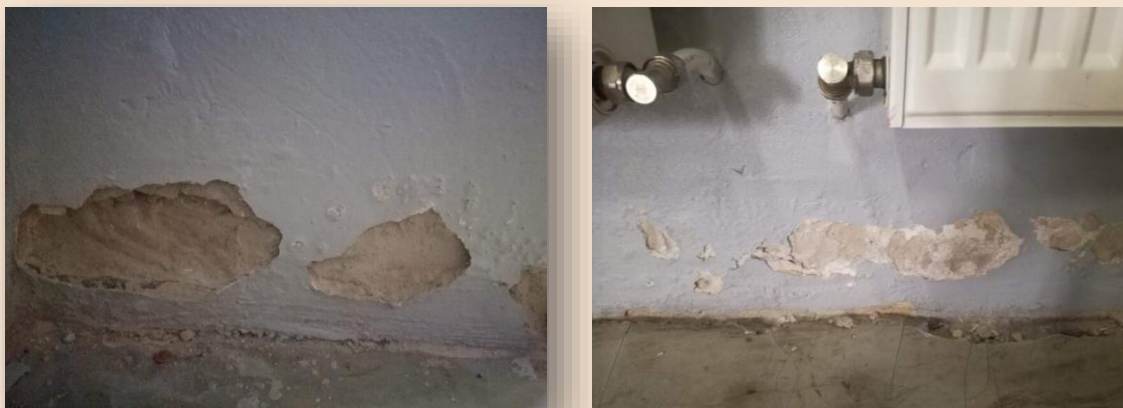
Obrázok č. 3 a 4 – Fotografie Kultúrneho domu pred rekonštrukciou

Ústredné kúrenie sa doplnilo aj do divadelných priestorov. Po rekonštrukcii vznikli dôstojené priestory na kultúrne podujatia a na prenájom širokého okolia.