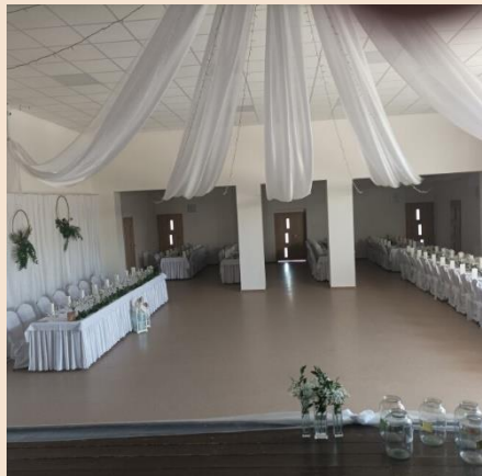
Obrázok č. 5 – Fotografia Kultúrneho domu po rekonštrukcii