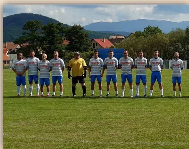
OŠK Stožok, rok 2020