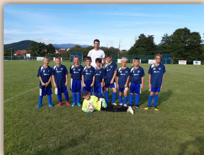
OŠK Stožok – U11, rok 2020