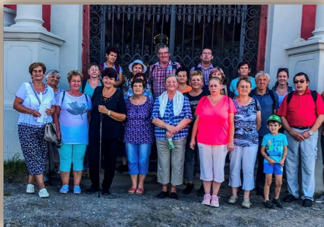
Jednota dôchodcov Stožok, rok 2020