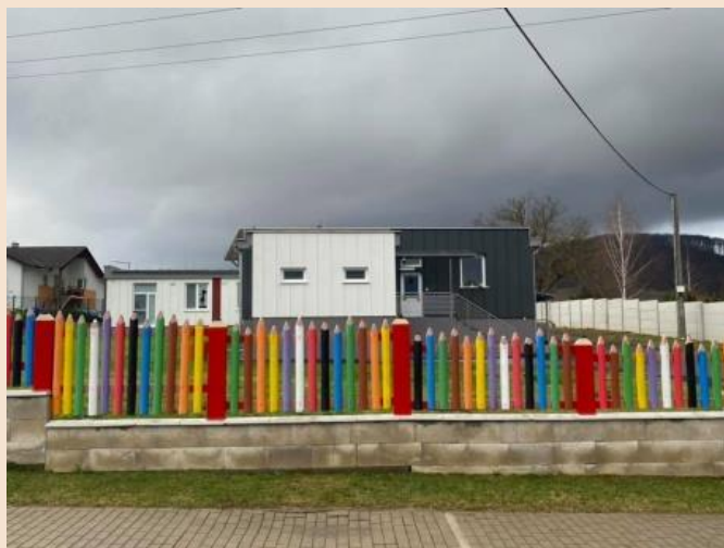
Materská škola Stožok, rok 2020