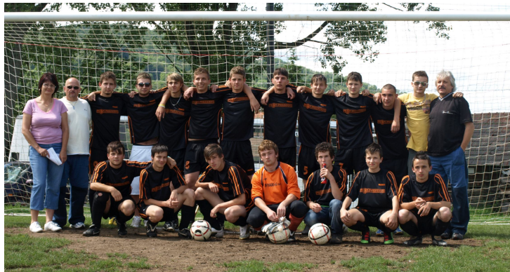
OŠK Stožok – dorast