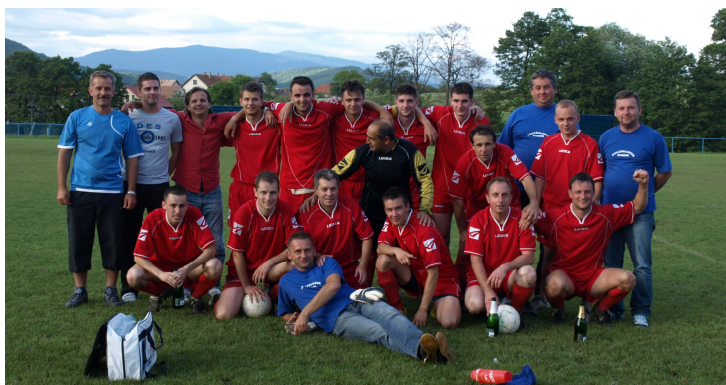
OŠK Stožok – mužstvo „A“