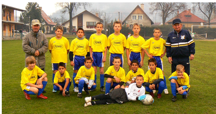
OŠK Stožok – mladší žiaci