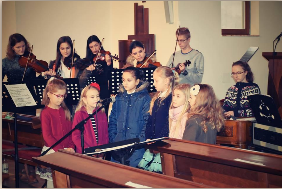
Vianočný benefičný koncert