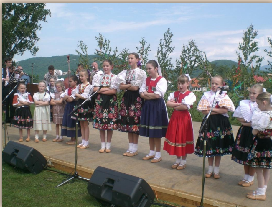
Gulášmajster – 28.5.2016