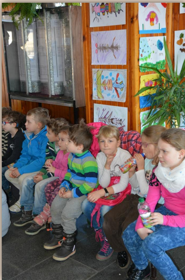
Týždeň kultúry – vernisáž na železničnej stanici