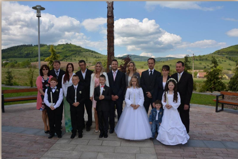
Prvé sväté prijímanie – 8.5.2016