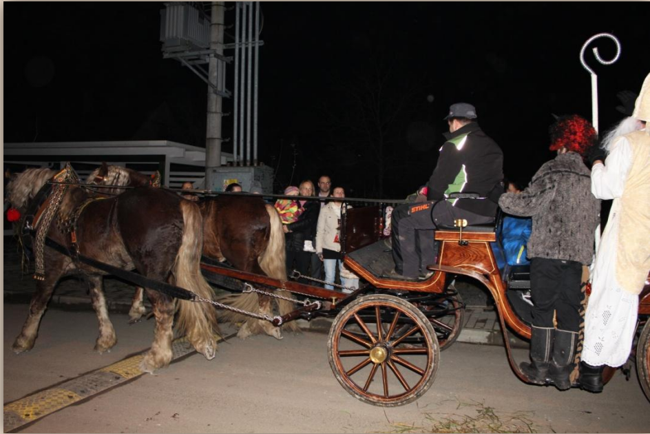
Mikuláš – 6.12.2016