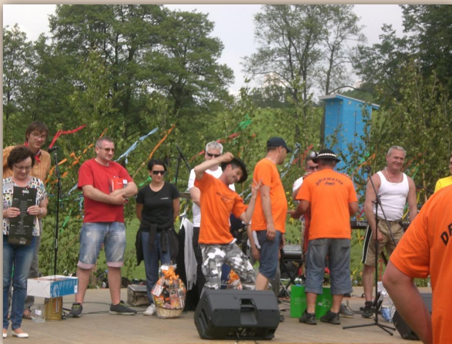
Gulášmajster – 28.5.2016