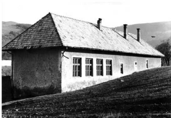
Stará škola postavená u Vyletelovcov v rokoch 1895-1900

Vzťahy rodičov s učiteľmi boli úplne iné ako dnes. Učiteľ sa ľudia vážili, čo mohli alebo mali, priniesli. Či už to bola kapusta alebo mlieko. Pri svojpomocnom budovaní školy pomáhali, priniesli domácu pálenku pre robotníkov. On sám vozil murárov zo Zvolena vlastným autom.