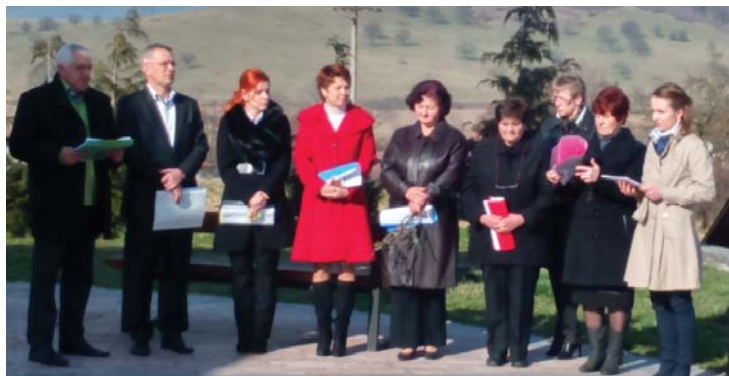
Farský spevokol umocnil svojimi piesňami atmosféru Veľkej noci.